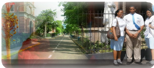
Jesuit Center, St George College - Kingston, Jamaica